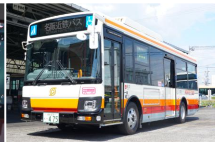
↑バス車両（イメージ）