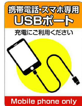
↑車内外掲示用ステッカー（イメージ）